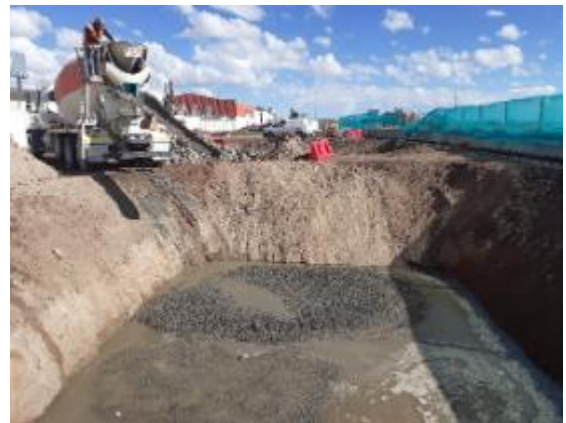
Foto N° 06 Fundaciones Parque Las Industrias